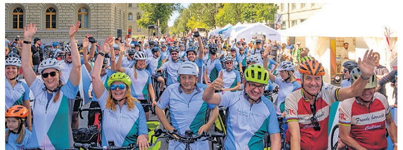
Ein gemeinsames Ziel: Menschen mit Krebs spüren lassen, dass sie nicht allein sind