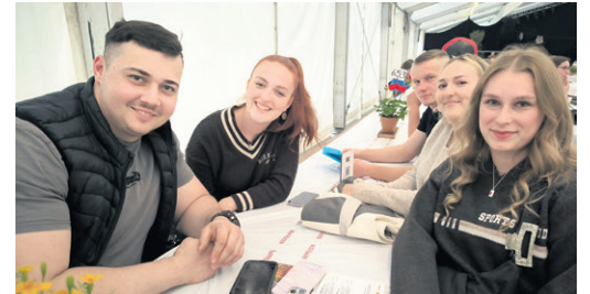
Vechigen Jahrgang 2002/2003