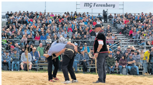
Bester Schwingsport vor eindrücklicher Kulisse