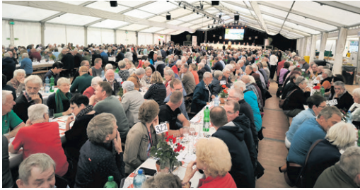
1200 Person waren an der Versammlung zugegen

Bereits am Donnerstag, 7. Mai sorgte die Raiffeisenbank Worblen-Emmental als Hauptsponsorin mit ihrer Delegierten- und Mitglieder-versammlung inklusive einem Überraschungskonzert von Oesch's die Dritten für ein volles Festzelt und beste Partystimmung.