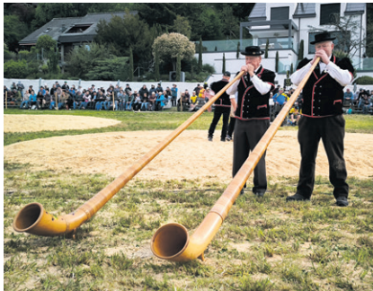
Alphornbläser liessen das Worblental erschallen