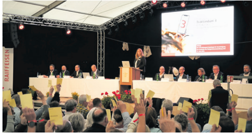
Zuerst die Arbeit...