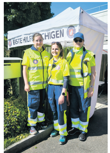
Erste Hilfe Vechigen versorgten grössere und kleinere Verletzungen