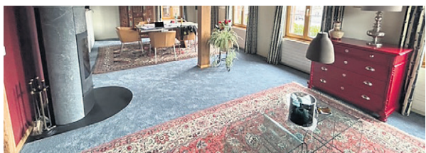
Teppichboden in Bauernhaus (Englischer Steal)