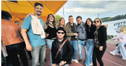
Bolligen Jahrgang 1980