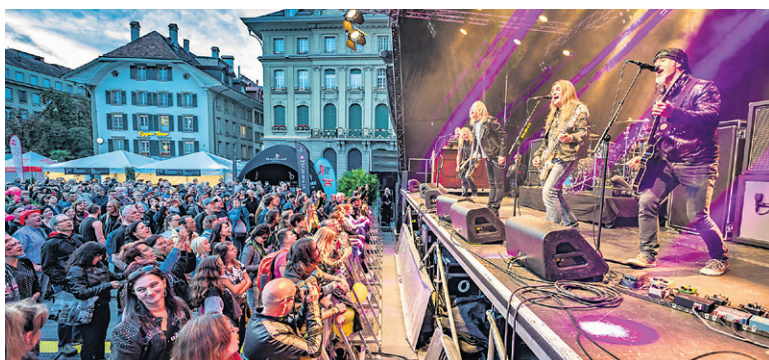
Bekannte Musiker und Musikerinnen spielen zusammen für eine Sache. Music for Life – die Allstar Band des Ride for Life