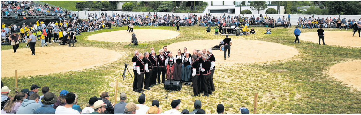
Auftritt Jodlerklub Echo Boll