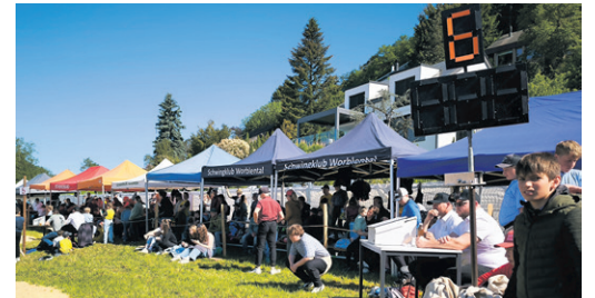
Gebannt wird das Geschehen am Jungschwängertag verfolgt