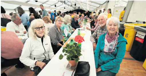
Jahrgänger 1948 bis 1959 der Gruppe Ferenberg

Am 8. Mai startete das offizielle Festwochenende mit einem riesigen Jahrgängertreffen der ehemaligen Schülerinnen und Schüler aus Stettlen, Vechigen und Bolligen – ein Abend ganz im Zeichen der Freundschaft, Erinnerung und Fröhlichkeit.