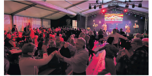
...dann das Vergnügen