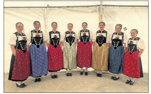
Die Ehrendamen tragen mit ihrem stilvollen Auftritt zur besonderen Atmosphäre des Schwingfests bei