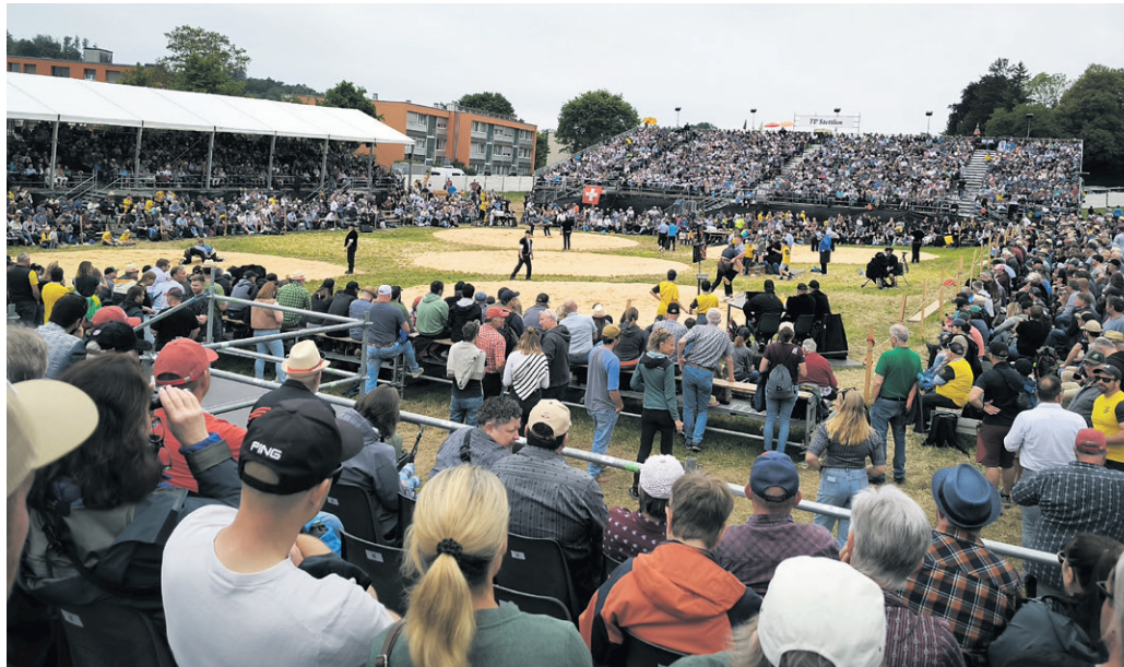
Eindruckliche Schwingfest-Arena mitten in Stettlen

STETTLEN 2026 MITTELLÄNDISCHES SCHWINGFEST 8.-10. Mai Medienpartner