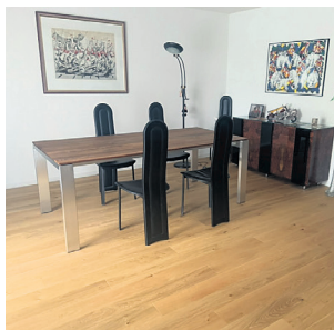
Parkettboden in Wohn- und Esszimmer in Ostermundigen