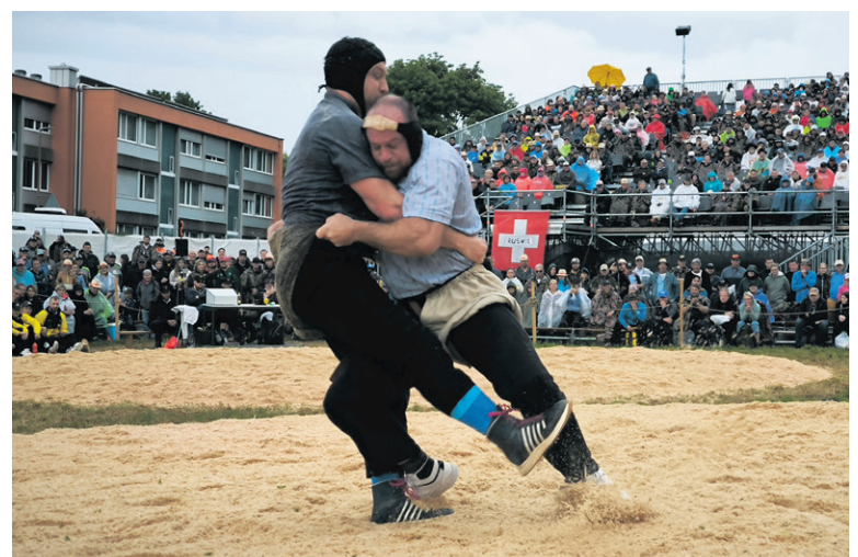
Der Haken zum entscheidenden Schwung