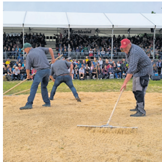
Männer am Rechen