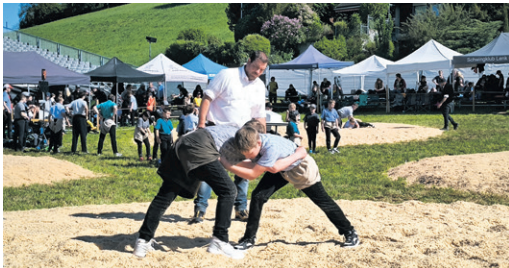
Jungschwinger in Aktion

Bei prächtigem Wetter war es am 9. Mai an den Jungschwängern, im Sägemehl ihr Können unter Beweis zu stellen. Fest- und Barzelt mit Livemusik und währschaftem Essen boten guten Grund, noch etwas länger zu verweilen und das Gemeinschaftliche bis in den Abend hinein zu geniessen.