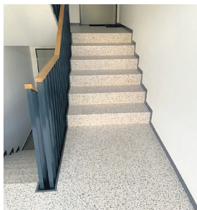
Homogener Vinylboden Rutschhemmend in 6-stöckigem Treppenhaus