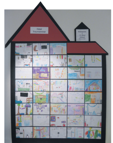
Das Hotel «Traumbzimmer» der Kindergärteler