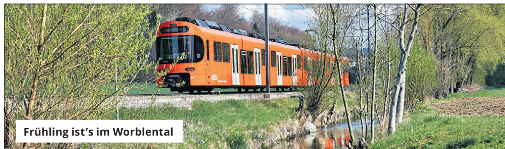
Frühling ist's im Worblental

Das Müli OpenAir ist ein Musikfestival, welches alle vier Jahre im Garten der Müli Deisswil stattfindet. Seit seiner Gründung hat sich das Festival zu einem regionalen Event im Worblental entwickelt und bietet eine vielfältige Auswahl an regionaler Live-Musik, kulinarischen Genüssen und Gemeinschaftserlebnissen. Das Organisationskomitee besteht aus Freiwilligen, die sich leidenschaftlich dafür einsetzen, ein unvergessliches Wochenende voller Musik und Spass im Worblental zu gestalten. Termin: Freitag, 2. und Samstag, 3. August 2024.