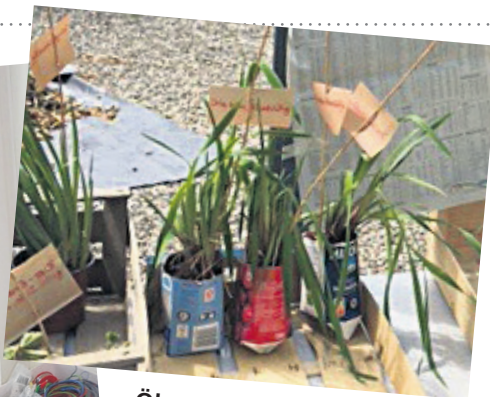
Ökonomisch und ökologisch: die Pflanzentauschbörse

sorgfältig gepflegtes Zweirad hat auch eine längere Lebensdauer. Wenn Sie froh sind, wenn Ihnen diese Reinigungsarbeit jemand abnimmt, dann ist das die Gelegenheit. Die aufgestellte und aktive Truppe der Pfadi Steibruch übernimmt die Arbeit und lässt jedes Bike in neuem Glanz erstrahlen. Kostenpunkt hierfür ist je nach Zustand CHF 10.– bis 20.– pro Velo in die Pfadikasse, damit die Kids gemeinsam einen coolen Ausflug machen können.