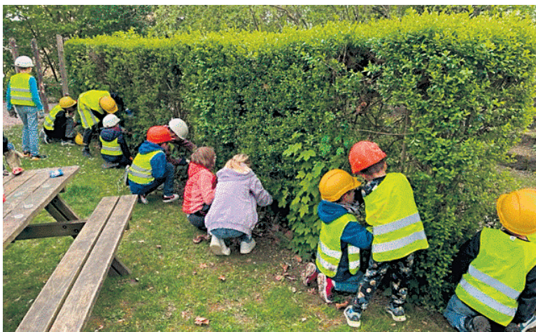
Hilfreiche Hände zum Start des neuen Spielplatzes

Mit grosser Freude und der Unterstützung zahlreicher Kinder wurde am Freitag, 26. April 2024 mit dem symbolischen Spatenstich die Bau-