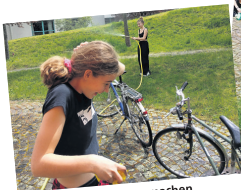
Arbeit darf auch Spass machen

In den Frühling hinausfahren lässt es sich schöner mit einem frisch gereinigten Velo und ein