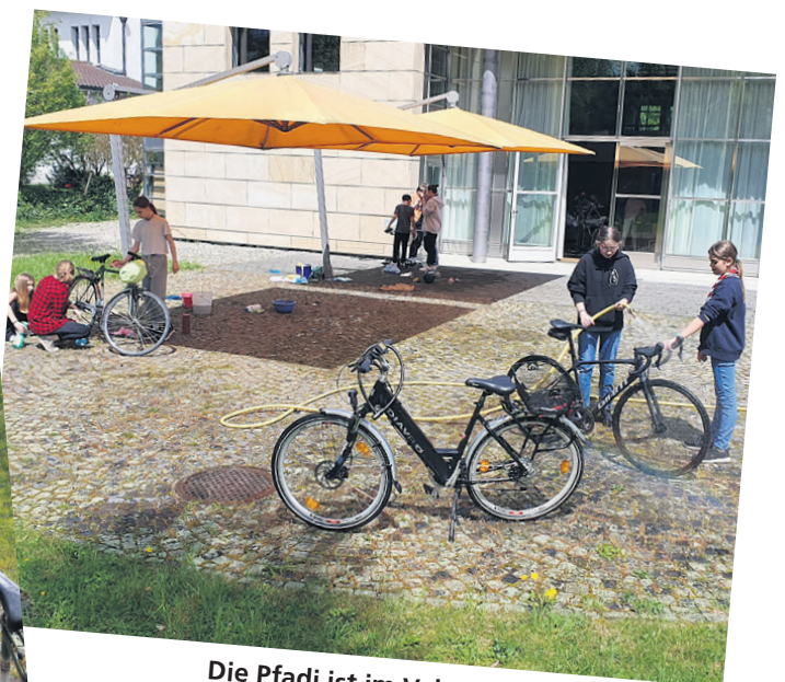
Die Pfadi ist im Veloputzen bereits geübt

Das Repair Café, die Veloreinigung und -sammlung sowie die Pflanzentauschbörse finden am Samstag, 11. Mai 2024, 11 bis 15 Uhr im und um das reformierte Kirchgemeindehaus Ostermundigen an der Oberen Zollgasse 15 statt.