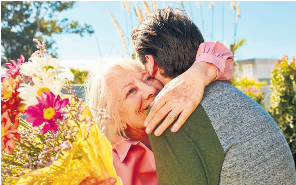
Eine schöne Geste und liebevolle Umarmung zum Muttertag macht Freude

Lokalzeitung und Vereinsorgan mit amtlichen Publikationen für die Gemeinden Bolligen, Ittigen, Ostermundigen, Stettlen und Vechigen. Grossauflagen auch für Worb und Krauchthal/Hettiswil