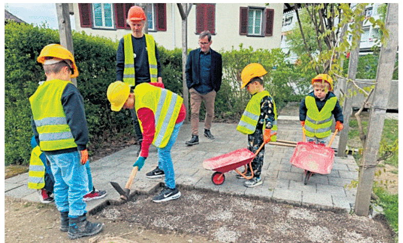
Keiner zu klein, ein tüchtiger Helfer zu sein