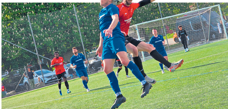
Auch in der Lft behielten die Ostermundiger (in rot) die Oberhand