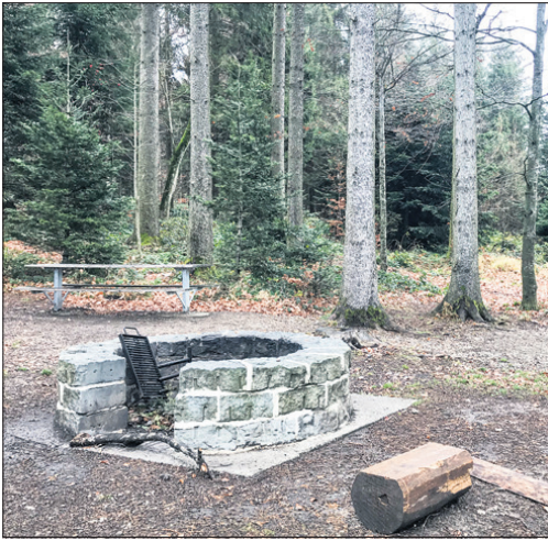
Brätlistelle Mänziwilegg, am Waldrand, Nähe Parkplatz

Die Gemeinde Vechigen hat für diese Ausgabe keine Gratulationen und amtliche Publikationen gemeldet.