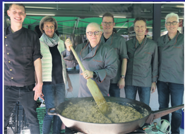
Kiwanis-Helfer am Risotto rühren (Merci für den Einsatz)