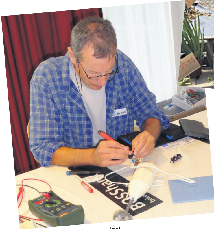
Hier wird fachkundig repariert

Die Idee vom Repair Café ist nicht neu, aber nach wie vor top und wird mittlerweile schweizweit an zahlreichen Orten durchgeführt. In Ostermundigen lädt die reformierte Kirche am kommenden Samstag zum nächsten Repair Event ein. Diesmal wird jedoch nicht nur geflickt und repariert, sondern es entsteht mit Unterstützung der Pfadi Steibruch Ostermundigen, den Gartenfreunden Region Bern und des Drahtesels / Velafrica ein regelrechter Multi-Event an nachhaltigen, unterstützenden Angeboten. Und so funktioniert: