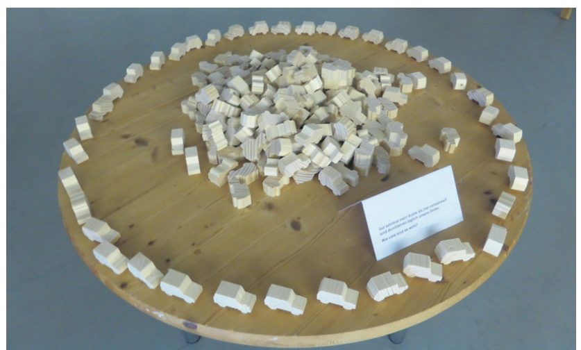
Zehnmal mehr Autos als dargestellt fahren täglich durch die Gemeinde Krauchthal